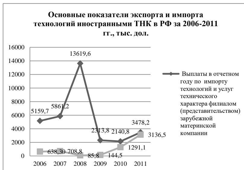
Рисунок Е. 1 – Основные показатели экспорта и импорта технологий иностранными ТНК в РФ за 2006-2011 гг., тыс. дол.